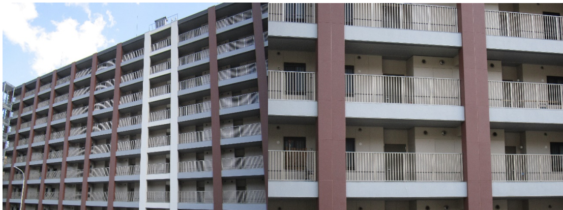
共用廊下手摺 持ち出し縦格子スタイル