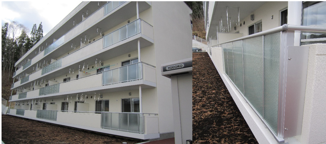
バルコニー手摺 持ち出しガラススタイル、トップレールスタイル 隔て板 PTD タイプ