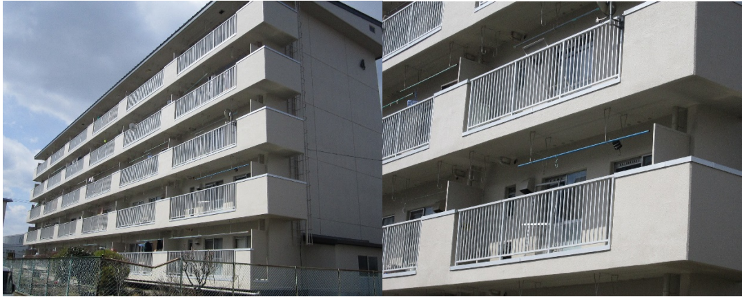
バルコニー手摺付笠木 標準縦格子スタイル 笠木 SKS タイプ