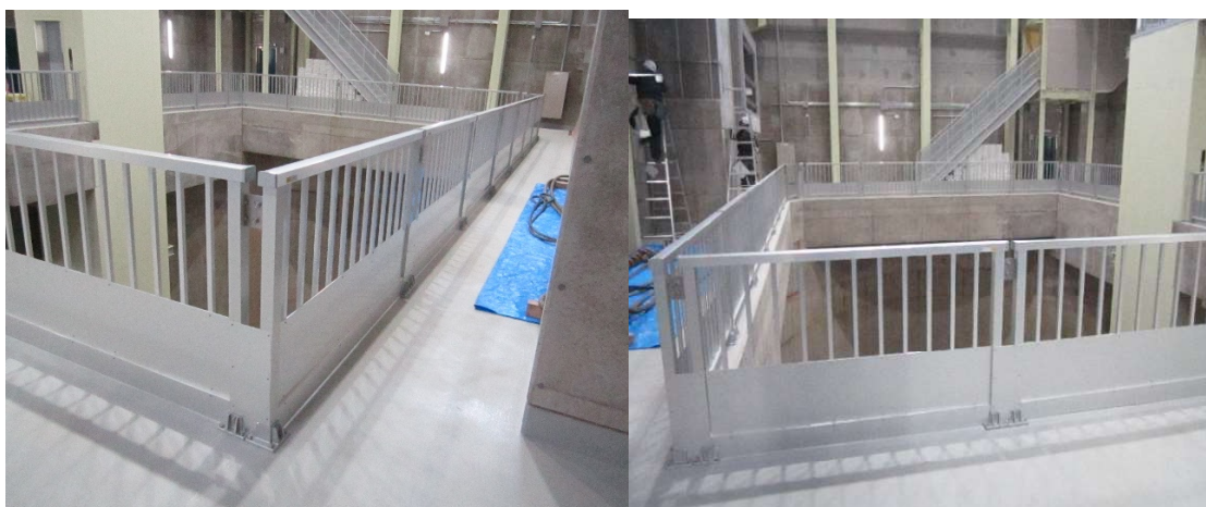
水力発電所内 手摺（日本下水道事業団仕様）ベースアンカースタイル